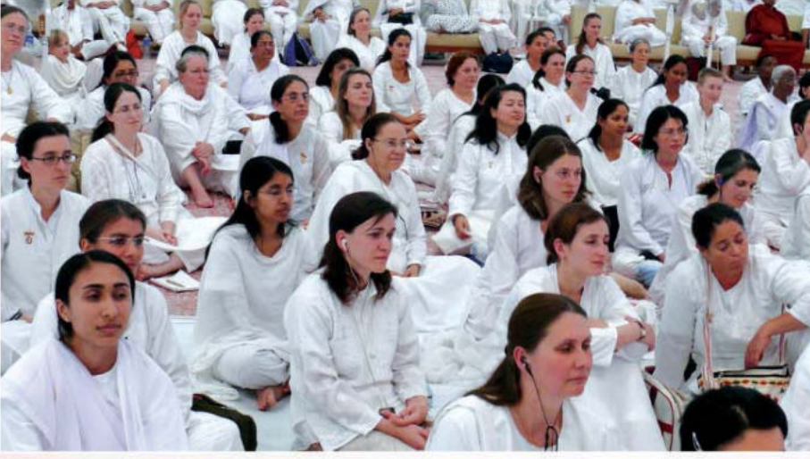
ईश्वरीय ज्ञान का श्रवण करते हुए विदेशी भाई-बहनें।

वर्तमान समय मूल्यों के पतन के दौर से गुजर रही दुनिया के लिए भारत एक आशा की किरण बनकर उभरा है, जहाँ 20वीं सदी के दूसरे एवं तीसरे दशक में यूरोप के विद्वानों ने शान्ति व स्वयं की पहचान तथा आध्यात्मिक सत्य को समझने के लिए भारत की यात्रायें कीं। वहीं श्रीमद् भगवद् गीता एवं अन्य धर्म शास्त्रों का जर्मन एवं अंग्रेजी भाषा में अनुवाद किया गया। साथ ही विक्टोरिया युग के अंत के समय में स्वामी विवेकानंद ने पश्चिमी देशों की यात्रायें कर भारतीय अध्यात्म और योग का संदेश दिया।