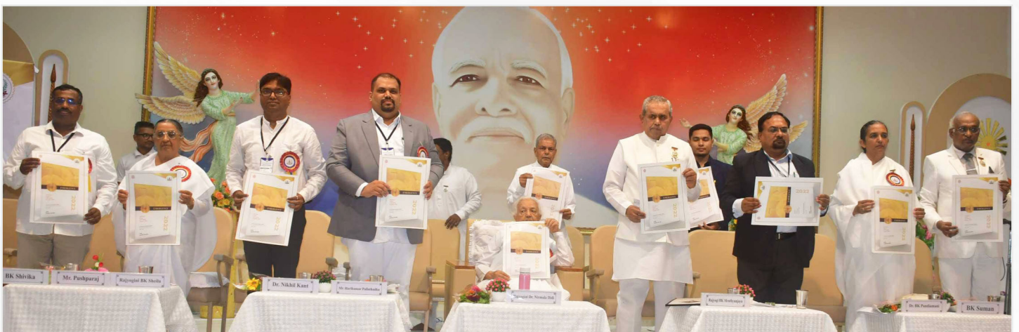
Launching of " Emergence Journal of Science and Spirituality " during University & College Educators' Conference held in August at Brahma Kumaris Manmohinivan Campus, Abu Road.

Under this project, programs such as online webinars, youth dialogues, competitions, youth challenges through social media, etc. will be held to motivate the youth towards positive lifestyle and engage them in social services.