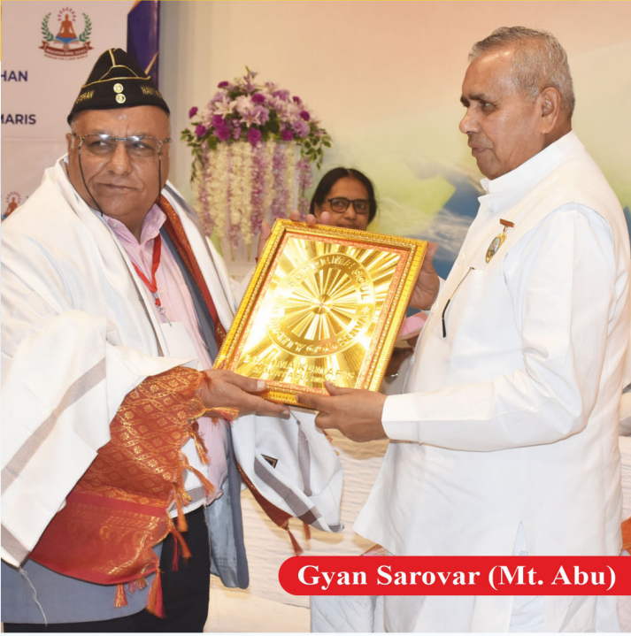
Gyan Sarovar (Mt. Abu)