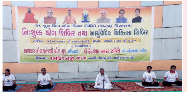
अमदावाड षसनपुर जाते 'विश्व योग दिवसे' पतंजलि योग ग्रुप, हेगडेवार स्मारक समिती द्वारा आयोजित योग शिबिरमां राजयोगानो संदेश आपतां प्र.कु. जगृतिभेन.