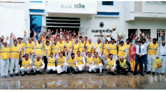
સુરત મોટા વરાછા દ્વારા ચૌઠા બજાર થી વેલંજ સુધીના વિસ્તારમાં આયોજીત 'સડક સુરક્ષા યાત્રા' અભિયાનના યાત્રીગણ.