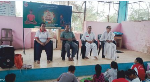
આહવામાં ગુજરાત રાજ્ય યોગ બોર્ડ દ્વારા આયોજિત 'સમર કેમ્પ યોગ'માં પ્ર.કુ. ઈનાબેન બાળકોને મૂલ્ય શિક્ષણનું મહત્વ સમજાવતાં.