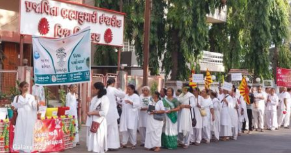
नवसारीमां 'विश्व पर्यावरण दिवसे'ना दिवसे वृक्षारोपण कार्यक्रम आड पर्यावरण जगृतिना संदेश माटे आयोजित रेलीनुं दश्य.