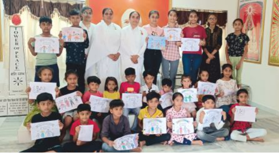
પડધરીમાં 'કિડ્ઝ કેમ્પ' દરમિયાન 'વિશ્વ પરિવાર દિવસ'ના થીમ પર ચિત્ર સ્પર્ધામાં ભાગ લેનાર બાળકો પ્ર.કુ. જુજ્ઞાબેન, પ્ર.કુ. શીલુબેન.