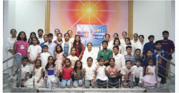
અમદાવાદ ચાંદખેડા સેવાકેન્દ્ર પર 'કિડ્ઝ મેગા સમય કેમ્પ'ના કાર્યક્રમમાં ભાગ લેનાર બાળવુંદ સાથે પ્ર.કુ. સંગીતાબેન.