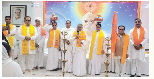
અમદાવાદ સુખશાંતિ ભવન ખાતે આયોજીત 'રામજન્મભૂમિ મહોત્સવ' કાર્યક્રમમાં દીપ પ્રજ્વલન બાદ સમૂહચિત્રમાં પ્ર.કુ. અમરબેન, પ્ર.કુ. નંદાબેન તથા અન્ય.