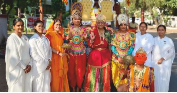
માંજલપુર સેવાકેન્દ્ર દ્વારા અયોધ્યાના રામ મંદિર નિર્માણ પ્રાણ પ્રતિષ્ઠા મહોત્સવ નિમિત્તે આયોજીત ઝાંખીનું દર્શ્ય.