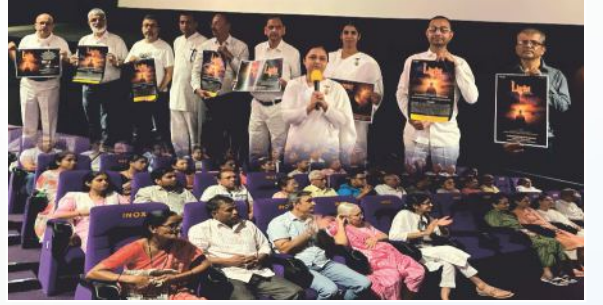
સુરત ઉધના ખાતે VR Mall થીએટરમાં 'ધ લાઈટ' ફિલ્મના પ્રમોશન શો સમયે ફિલ્મ વિશેની સમજૂતી આપતાં પ્ર.કુ. રચનાબેન તથા દર્શકગણ.