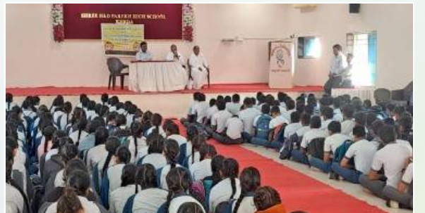
પેડામાં શ્રી એચ. એન. ડી. પોપ હાઈસ્કૂલમાં વિદ્યાર્થીઓને 'વ્યસન મુક્તિ' વિષય પર સમજ આપતાં પ્ર.કુ. તરૂબેન.