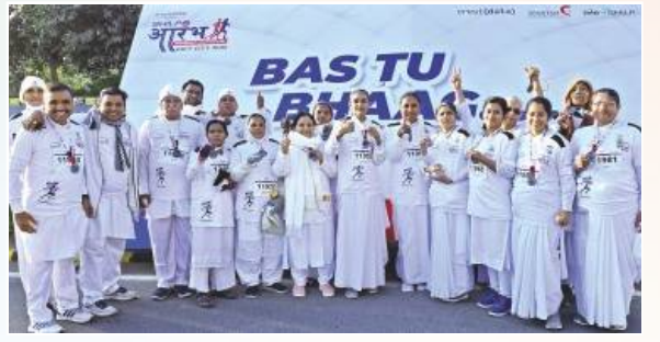
અમદાવાદ ખાતે 'વ્યસન મુક્ત ભારત મેરાથોન' બાદ સુખશાંતિભવન, ઈન્દ્રપ્રસ્થના સ્પોર્ટ્સ વીંગના પ્રતિભાગીઓ મેડલ સાથે સમૂહચિત્રમાં.