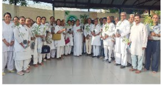
ભાવનગર સેવાકેન્દ્ર ખાતે 'વિશ્વ પર્યાવરણ દિવસે' પ્રાહ્મણ કુલવાડીને વિવિધ પ્રકારના છોડ અર્પણ કર્યા બાદ સંગઠનમાં પ્ર.કુ. વૃત્તિબેન.