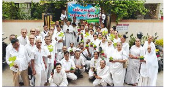
સુરત અમરોલીમાં 'વિશ્વ પર્યાવરણ દિવસે' હરિયાળી ધરતીના સંકલ્પ સાથે છોડ વિતરણ બાદ સમુહચિત્રમાં પ્ર.કુ. કવિતાબેન.