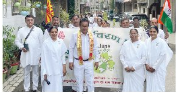
સુરત પરવત ખાતે 'વિશ્વ પર્યાવરણ દિવસે' જનજાગૃતિ ફેલાવવા આયોજીત રેલીમાં પ્ર.કુ. સંગીતાબેન તથા પ્રહ્લાવત્સો.