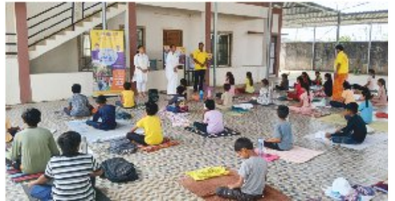
નખત્રાણા ખાતે ગુજરાત રાજ્ય યોગ બોર્ડ દ્વારા આયોજીત 'સમર યોગ કેમ્પ'માં બાળકોને રાજયોગ મેડીટેશનનો પરિચય આપતાં પ્ર.કુ. ટવીન્કલબેન બાબુમાં યોગ શિક્ષકો.