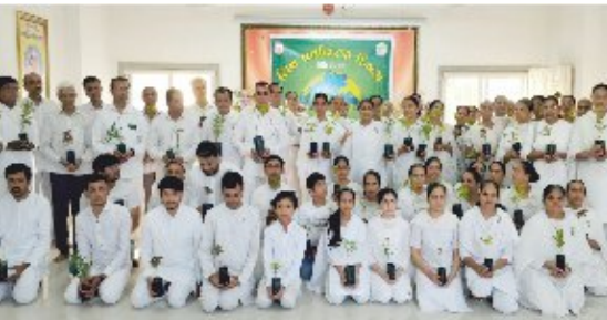
પાસોદરામાં 'વિશ્વ પર્યાવરણ દિવસે' સંસ્થાના નવદશકોત્સવ નિમિત્તે ૯૦ ભાઈ-બહેનોને છોડની સોગાત આપ્યા બાદ ગ્રુપમાં પ્ર.કુ.દર્ષાબેન.