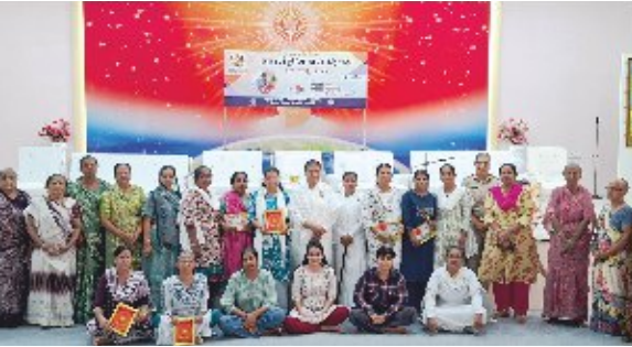
केशोदमां 'विश्व नर्स डे' निमित्ते आयोजित 'हमारी नर्स-हमारा भविष्य'ना कार्यक्रम भाद ग्रुपमां नर्स साथे प्र.कु. इपाभेन.