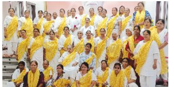
અગ્રામાં 'માતૃ દિવસે' 'મા-સુખી પરિવારની આધારશીલા' કાર્યક્રમમાં સર્જનાત્મક પ્રવૃત્તિઓ બાદ માતાઓ, પ્ર.કુ. સંગીતાબેન.