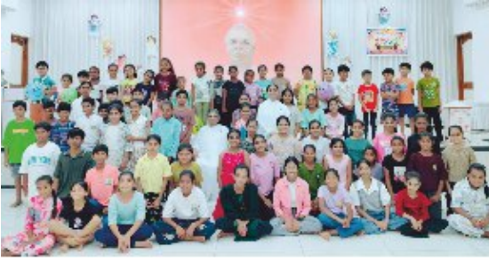
ભુજ તપસ્યાધામ સેવાકેન્દ્ર ખાતે આયોજીત 'લીટલ યોગી સમર કેમ્પ'નાં કાર્યક્રમમાં નાના ભુલકાઓ સાથે પ્ર.કુ. રક્ષાબેન.