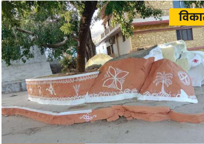
विकास की तस्वीर