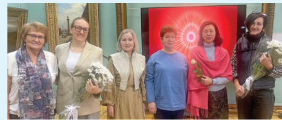
शिव आमंत्रण, इरकुत्स्क, रूस। इरकुत्स्क क्षेत्रीय कला संग्रहालय के सूचना और शैक्षिक केंद्र की परियोजना का नाम ब्रह्माकुमारीज राजयोग सेवाकेंद्र के सहयोग से वीपी सुकाचेव के नाम पर रखा गया है। इस परियोजना का मकसद है लोगों को उनके सपनों को साकार करने में मदद करना, आध्यात्मिक ज्ञान को व्यावहारिक जीवन में कैसे उतारा जाए इसका मार्गदर्शन प्रदान करना है।