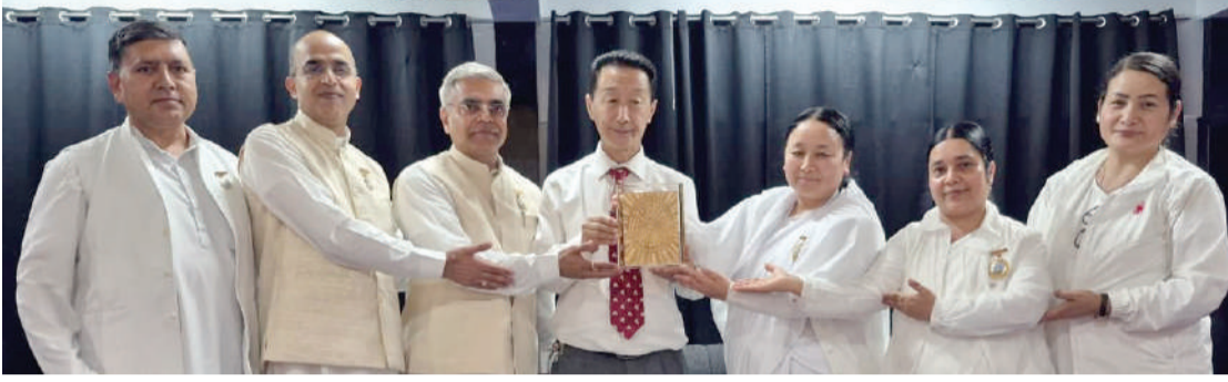
शिव आमंत्रण, गंगटोक/सिक्किम।

ब्रह्माकुमारीज के समाज सेवा प्रभाग द्वारा सिक्किम के विभिन्न विद्यालयों एवं महाविद्यालयों में संगम प्रतिज्ञा अभियान के तहत प्रेरणादायी सत्रों का आयोजन किया गया। इन कार्यक्रमों का उद्देश्य विद्यार्थियों एवं युवाओं में नैतिक मूल्यों, सकारात्मक सोच, आत्मविश्वास तथा आध्यात्मिक चेतना का विकास करना है।