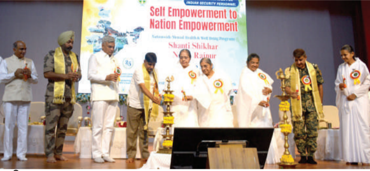
शिव आमंत्रण, नवा रायपुर, छग।