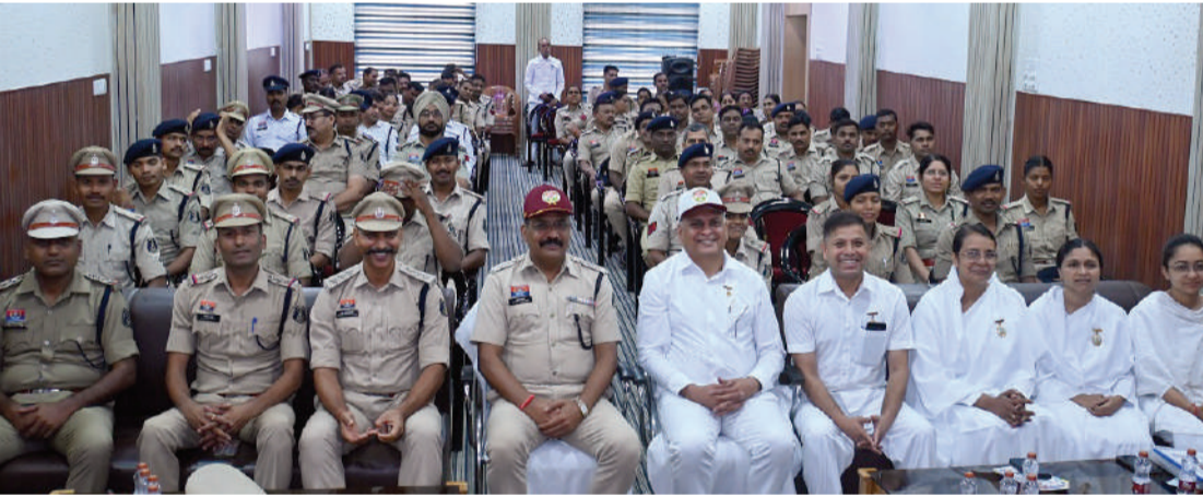
शिव आमंत्रण, मिलाल, छग।