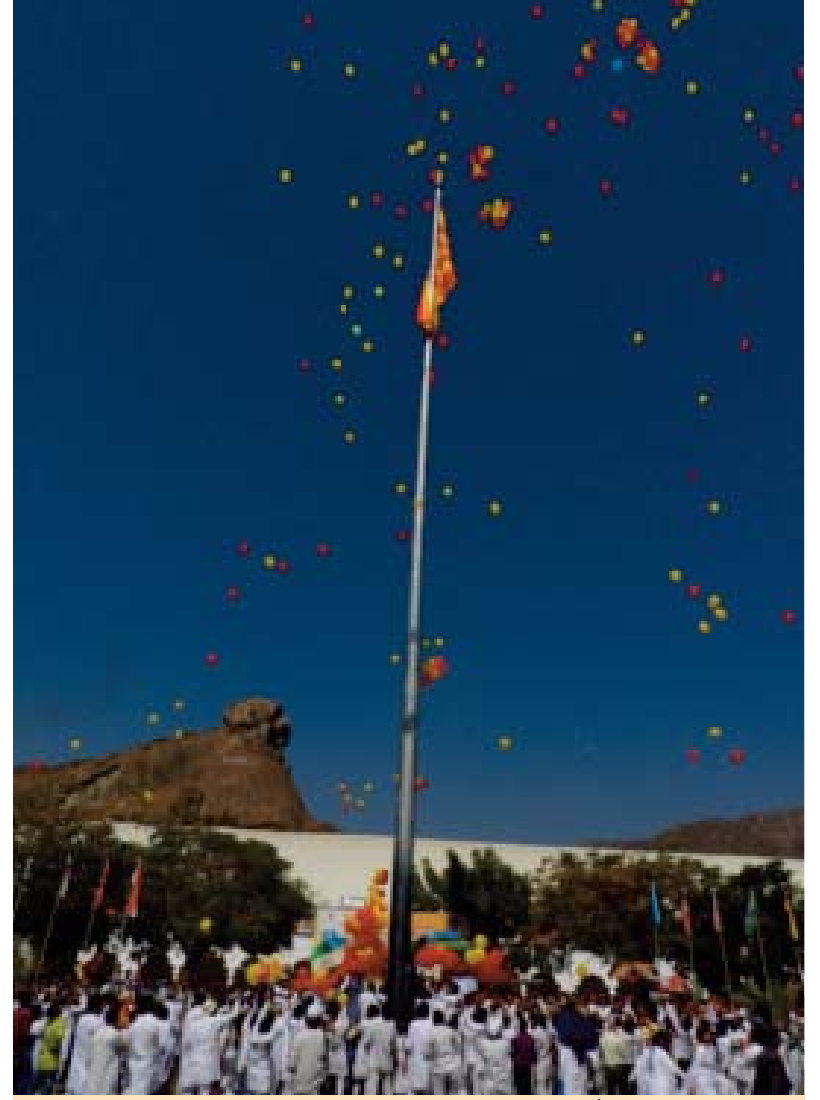
आडवाणी द्वारा ब्रह्माकुमारीज़ की स्थापना की 80वीं वर्षगांठ पर सौ फीट ऊँचे पोल पर शिवध्वज लहराया गया, जो कि समारोह के प्रमुख आकर्षण का केन्द्र बना।

बनाये रखने में ब्रह्माकुमारी संस्था बहुत ही महत्वपूर्ण भूमिका निभा सकती है। आज लोगों को आंतरिक रूप से सशक्त करने की ज़रूरत है। आज का समाज बाहरी रूप से अधिक सम्पन्न बन गया है, लेकिन फिर भी खुश रहने के मामले में बहुत पीछे होता जा रहा है।