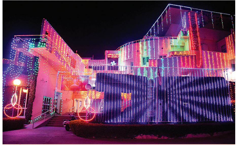
ज्ञानसरोवर-माउण्ट आबू। दीपावली के अवसर पर रोशनी से जगमगाता ज्ञानसरोवर परिसर व हार्मनी हॉल।