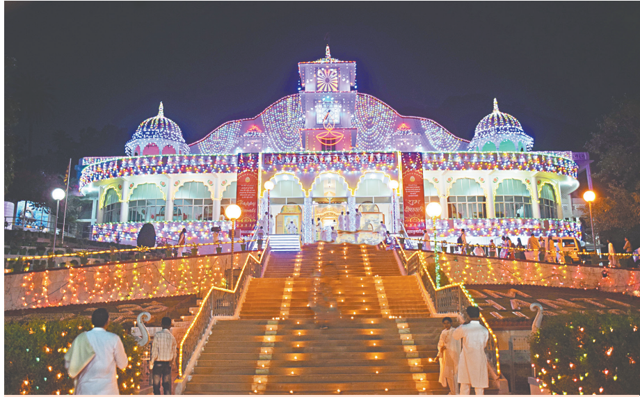
पाण्डव भवन-माउण्ट आबू। दीपावली पर रोशनी से रोशन करता युनिवर्सल पीस हॉल।