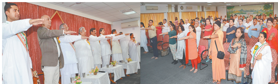
आपदा प्रबंधन एवं स्वच्छता अभियान कार्यक्रम में स्वच्छता की शपथ लेते हुए गणमान्य अतिथियों के साथ ब्र.कु. आशा तथा अन्य।

आपदा प्रबंधन एवं स्वच्छता अभियान का सफल आयोजन